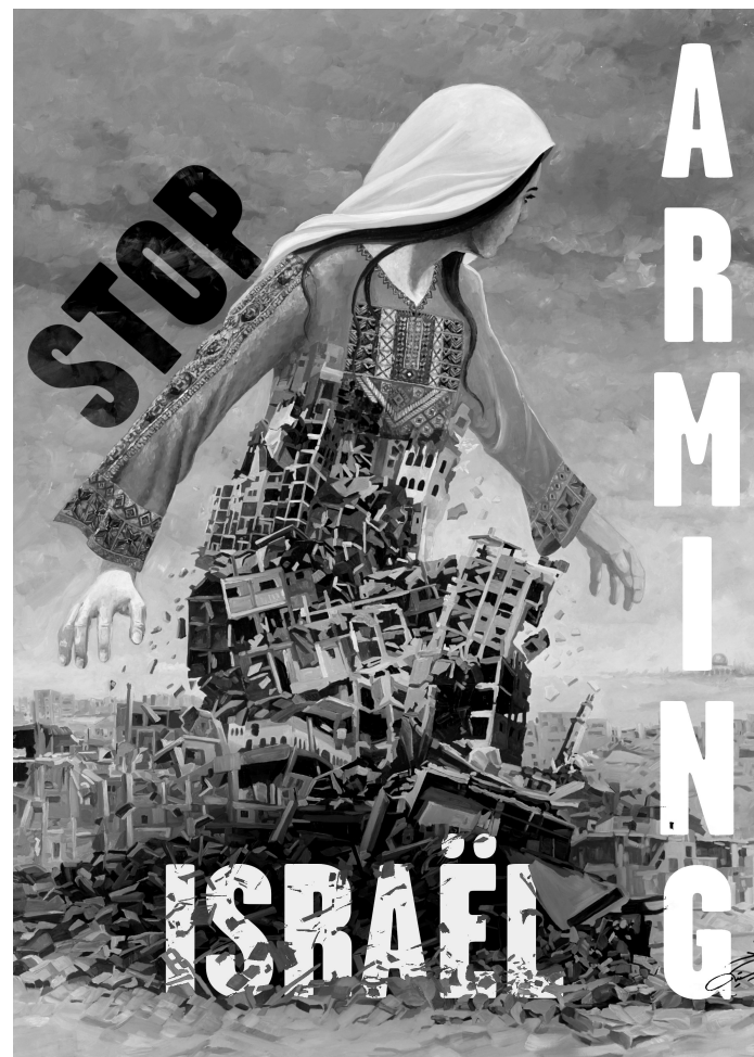
Affiche reprise de l'Israël Apartheid Week (IAW)