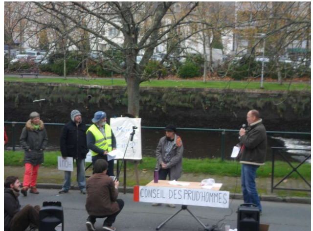
Illustration : Photos des saynètes du rassemblement 16 novembre.