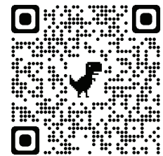
Notre dossier sur l'assurance chômage

J'adhère à mon comité de chômeurs CGT et j'adhère à la CGT, le seul syndicat qui organise les chômeurs